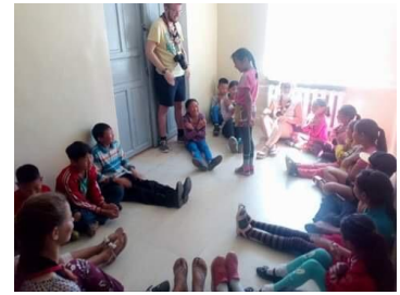
Janvier 2020 Tsetserleg sum, Nord Arkhangai aimag, Mongolie

Ce sont 40 paquetages qu'il faut monter à l'internat et installer dans les 15 chambres, chacun se voyant désigner un nouveau lit.